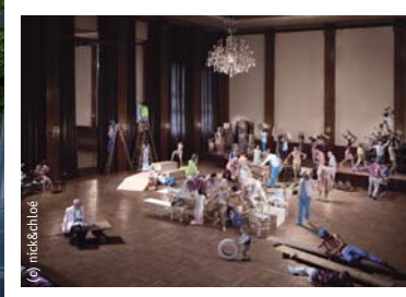
Festspielhaus St. Pölten: Die Reise beginnt